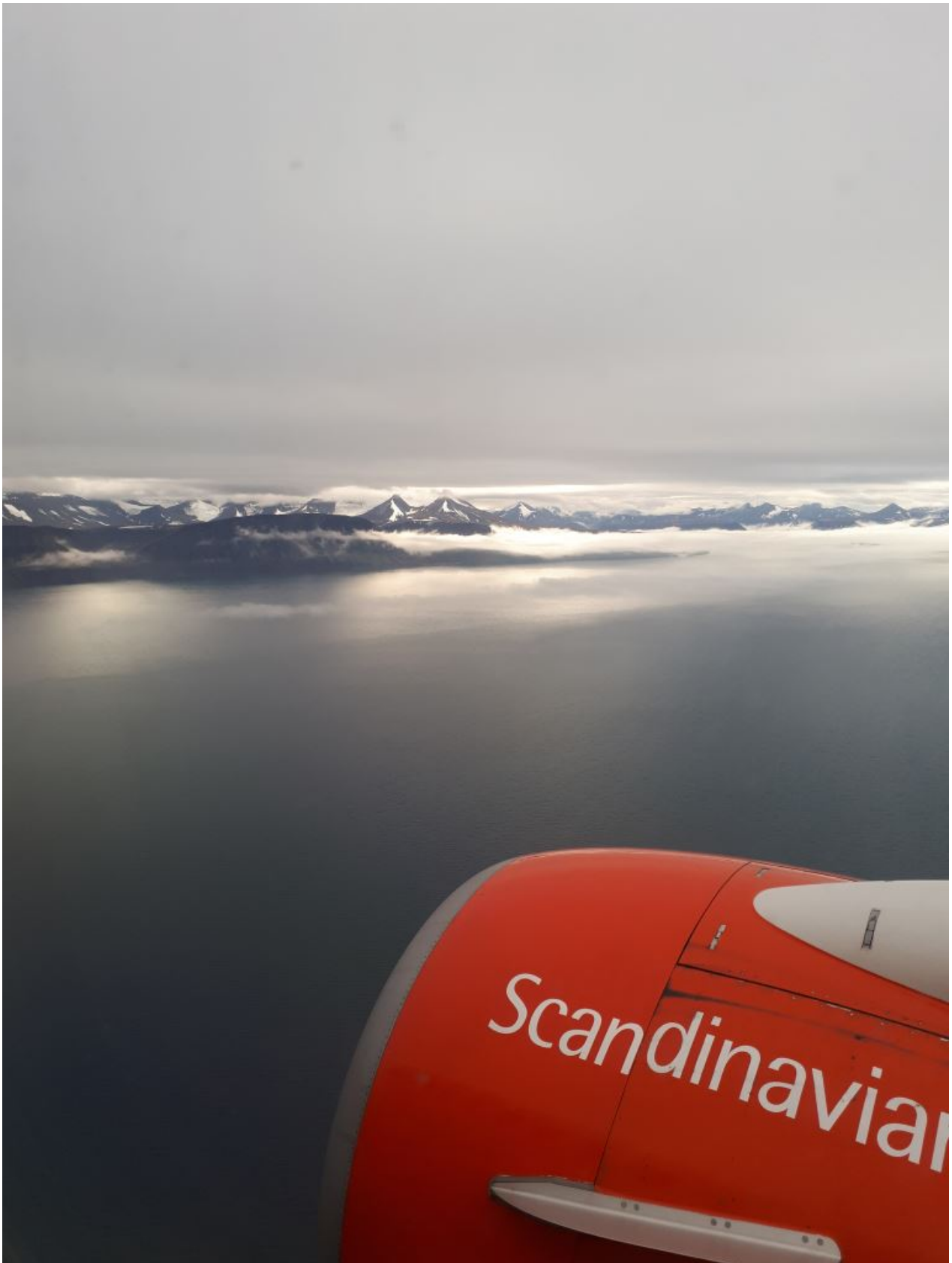
FIGURE 3. – Oh! Du ciel!

C'est donc avec 11 grosses heures de retard que je peux enfin fouler de mes pieds l'archipel du Svalbard. Vite, je saute dans la navette qui m'amène à l'hôtel car j'ai une première randonnée