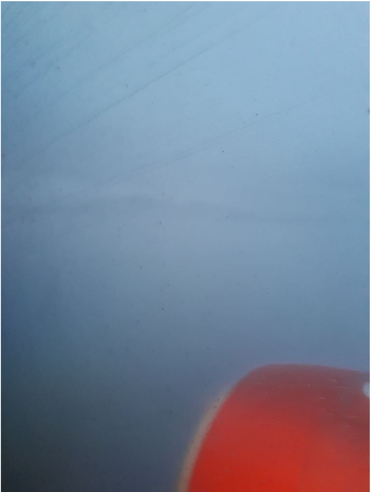
FIGURE 3. – L'approche finale sur Longyearbyen !

Comme vous pouvez vous en douter, l'avion n'a pas pu atterrir. Et rebelote lors de la seconde tentative du pilote. Ne pouvant pas rester indéfiniment dans les airs, nous sommes donc déroutés