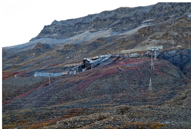
FIGURE 5. – Une ancienne mine de charbon

C'est tout pour ce premier épisode riche en émotions et en fatigue après plus de 24h sans dormir. En attendant le prochain épisode, je vous laisse sur l'entrée d'une ancienne mine de charbon + un petit teasing des événements à venir !