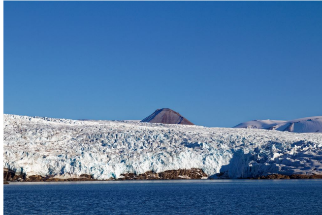
FIGURE 5. – Au prochain épisode !