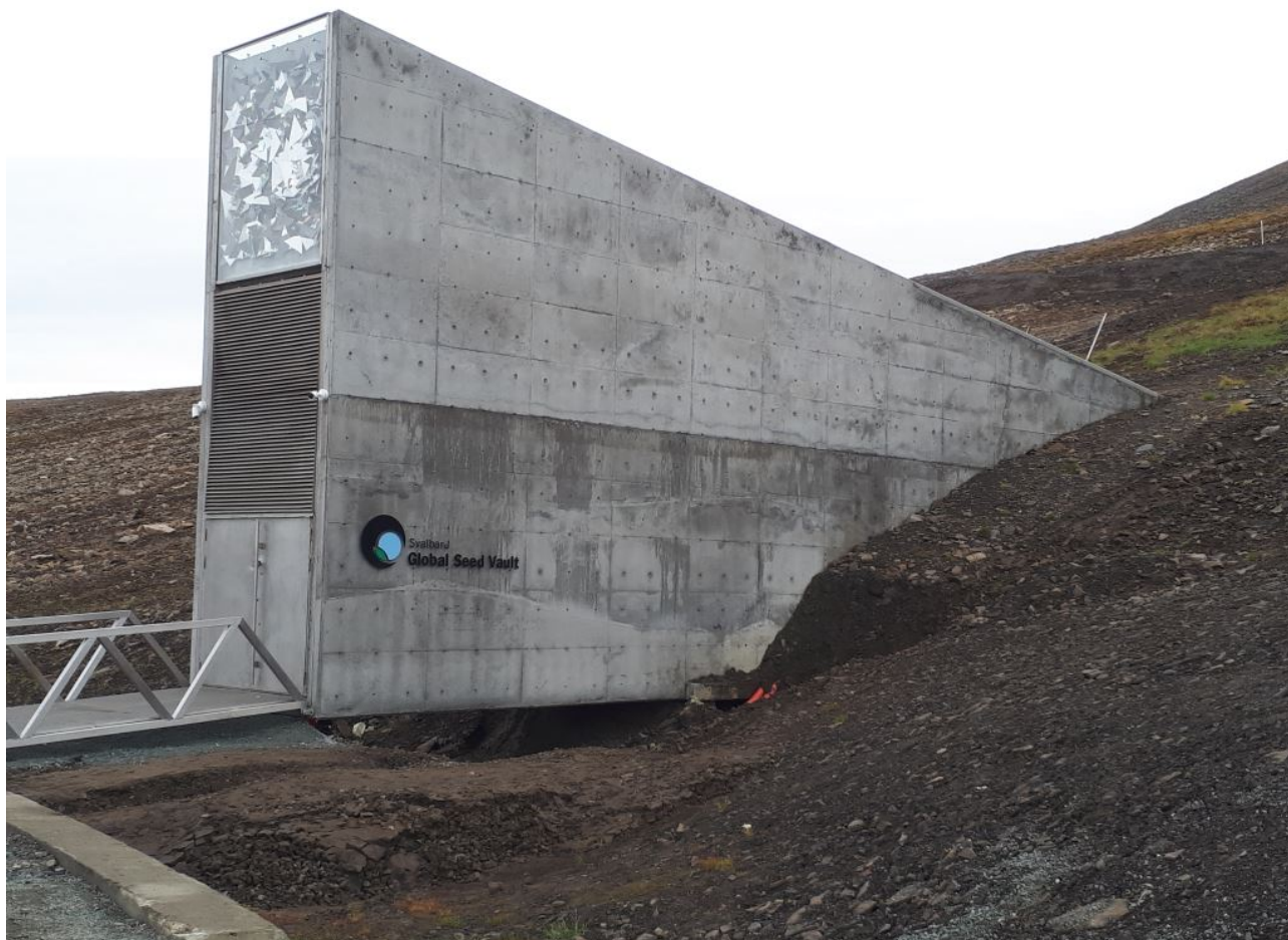
FIGURE 4. – Entrée du *Svalbard Global Seed Vault*