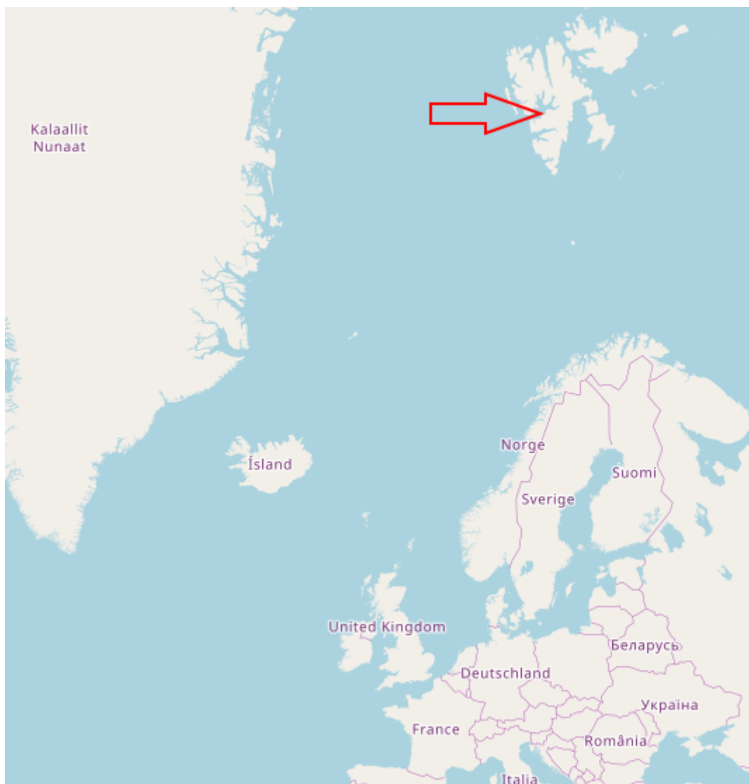
FIGURE 2. – Vous êtes ici!

Pour la petite info, le Svalbard est sous la souveraineté de la Norvège mais est en dehors de l'espace Schengen. Et, grâce au traité du Svalbard signé en 1920, c'est un territoire neutre et démilitarisé où tous les pays ont le droit d'exploiter les ressources naturelles locales. Récemment encore, la Russie maintenait une mine de charbon en activité à l'avant-poste de Barentsburg. De même, il y a encore neuf personnes qui vient à l'année, coupées du monde dans la ville fantôme de Pyramiden (pas de réseau de téléphonie, Longyearbyen à au moins 30 minutes en hélicoptère...).