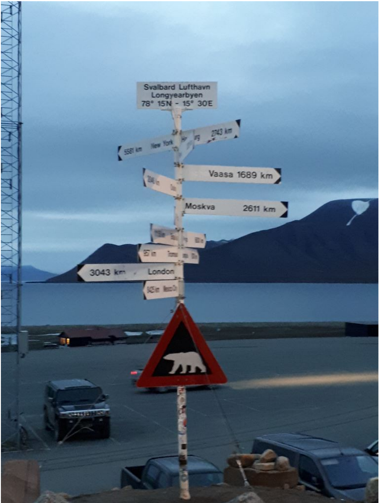
FIGURE 3. – Bienvenue à Longyearbyen ! (photo prise à 1h sur le retour)