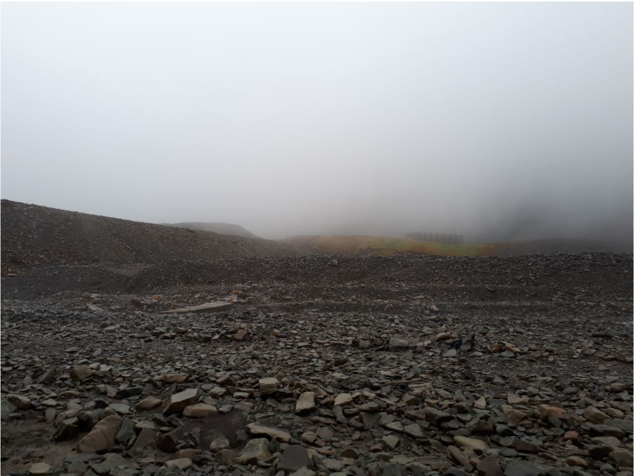
FIGURE 4. – Sur les hauteurs de Longyearbyen

Tout au long de nos déambulations, nous faisons quelques arrêts pour chercher des fossiles tout en buvant du sirop de sureau chaud (c'est super bon).