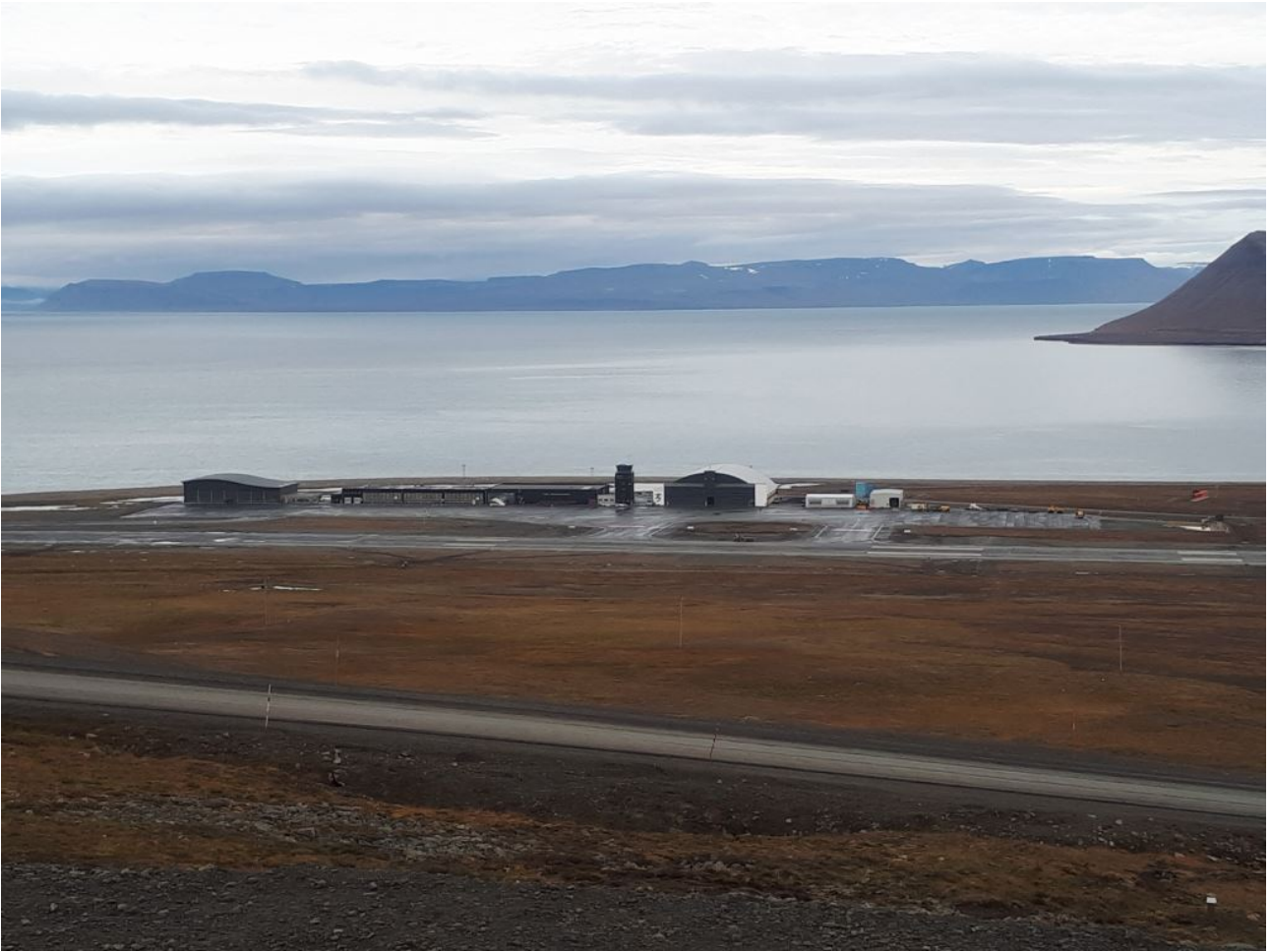
FIGURE 4. – L'aéroport de Longyearbyen

locales : un membre du fameux "avion retardé de onze heures". A ce sujet, petite pensée à toutes les personnes qui ont passé la nuit dans l'aéroport, attendant notre avion pour retourner à Oslo.