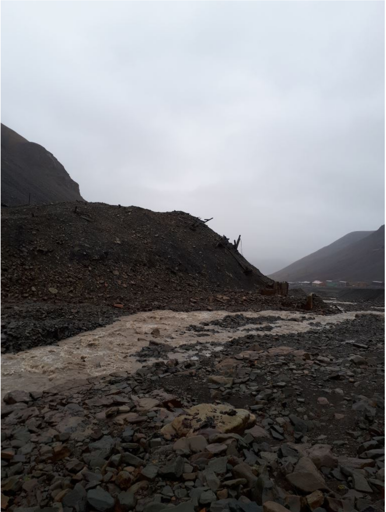
FIGURE 4. – "Ruisseau" local

Nous passons ensuite sur un autre versant avec une vue sympathique sur le fjord et l'aéroport de Longyearbyen. Soit dit en passant, je fais partie, avec mes camarades d'infortune, des célébrités