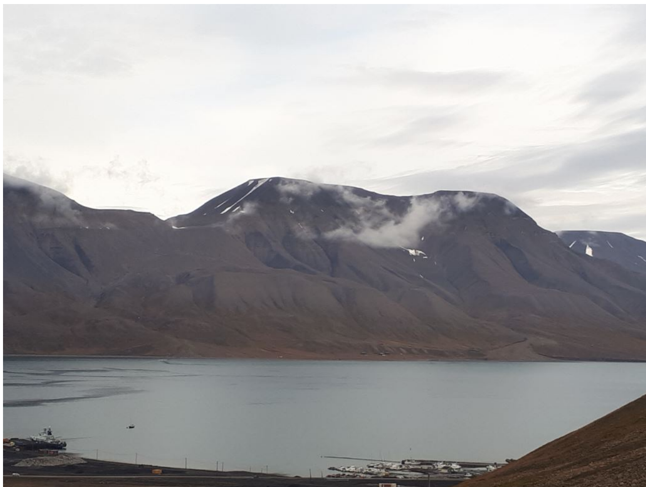
FIGURE 4. – Le fjord vu des hauteurs

La dernière partie de la randonnée nous amène au Svalbard Global Seed Vault . Ce bunker, construit dans le permafrost sert à stocker les semences de tous les végétaux cultivables de la planète afin de conserver la diversité génétique des cultures d'un pays en cas de catastrophe naturelle, technologique ou humaine. Un pays n'a le droit de récupérer tout ou partie de ses dépôts qu'en cas de force majeure. Le premier retrait a eu lieu en 2015 par l'état Syrien. Le bunker n'est pas ouvert au public donc tout ce que j'ai pu faire, c'est prendre l'entrée en photo.