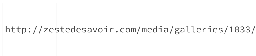
FIGURE 2. – ZEP-03 : le premier tutoriel est en attente d'un « Correcteur » et d'un « Illustrateur », le second est en bêta et cherche un « Repreneur »